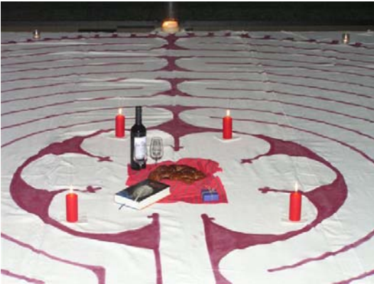
Een labyrint ligt klaar om betreden te worden.

Een lesproject over labyrinten en pelgrimstochten bijvoorbeeld bevat inhoud en kennis. Er volgt een toets voor punten, en voor sommigen is dat een brug te ver. De kennis is niet verwerkt. Het meditatief stappen van een labyrint levert geen punten op en toch doen ze het en met respect. Het heeft met het klokhuis te maken. Daarop kan/mag je geen punten geven.